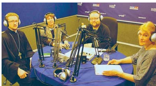
27 НОЯБРЯ НА РАДИО ГТРК «МУРМАН» В РАМКАХ ПРОГРАММЫ «СЕВЕР МОЙ» СОСТОЯЛАСЬ БЕСЕДА О ДЕЯТЕЛЬНОСТИ ПРАВОСЛАВНОГО ЦЕНТРА ПСИХОЛОГО-ПЕДАГОГИЧЕСКОЙ ПОДДЕРЖКИ «ОЧАГ»